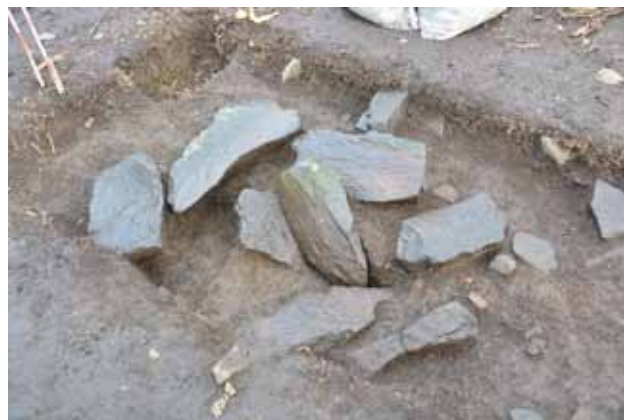
石を組み上げた儀礼場?

今年で4年目になる発掘調査が行われています。遺跡の中でも高い場所になぜかぼつかりと竪穴住居の無い空間が数箇所ありました。その一つを掘ってみると大きな石がいくつも集められていました。また、その周りでは多くの土器とヒグマの頭骨がみつかっています。今後の調査結果に期待が高まります。