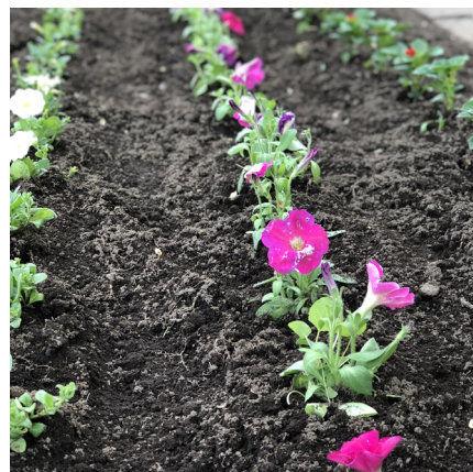
美しく花壇に並んだ花の苗

6月23日(日)のみどりの日に新たなイベント「しれはくフェス」を開催いたします。花壇づくりに加えて色々な企画があります。詳しい内容は別紙のチラシをご参照ください。