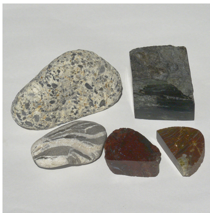
完成した手作りペーパーウェイト

しょう。▶日時：6月29日(土)10時、13時、15時の3回▶定員：小学生以上、各4名、要申込▶参加費200円(博物館協力会員は無料)▶服装：汚れても良い服装▶講師：合地学芸員※材料の石はこちらで用意しますが、磨いてみたい石をお持ちの方は持参しても結構です。あまり大きなものは磨けません。