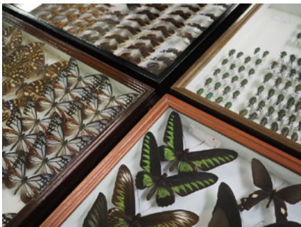
ドイツ箱に収められた昆虫標本