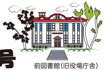
前図書館(旧役場庁舎)