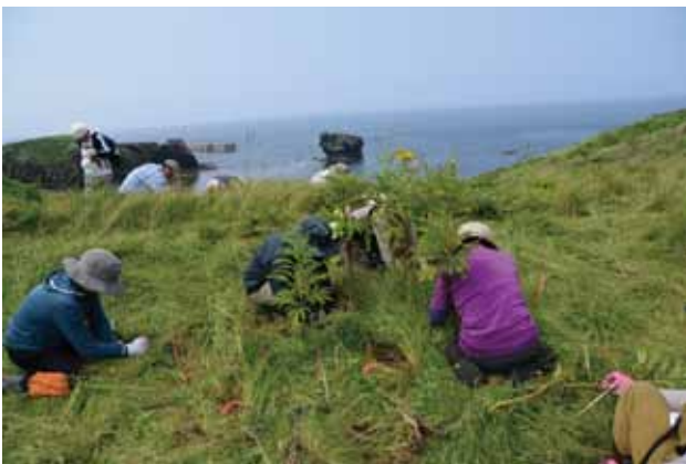
知床岬での町民ボランティアによる民族調査