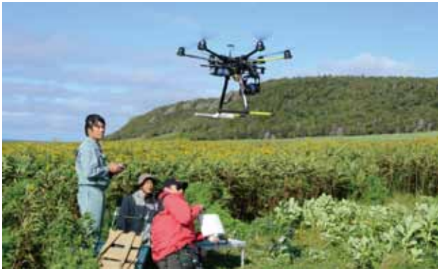
知床の雄大な風景をドローンで撮影