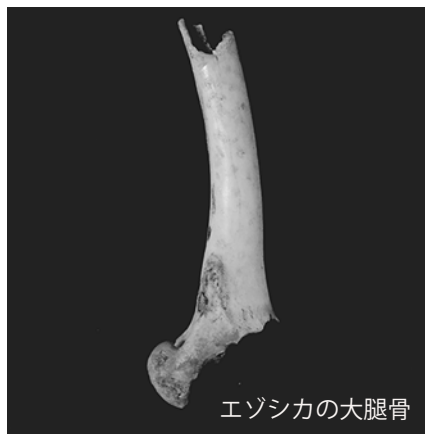
エゾシカの大腿骨

南の夜空には天の川をはじめとして、さそり座やいて座が輝き、頭上には夏の大三角形が現れます。多くの赤いガスの星雲を持ついて座や、縞模様がある木星、輪を持つ土星を観察しましょう。▶日時:8月4日(水) 19:30~20:30(悪天の場合順延)▶場所:本館前庭集合▶参加料:無料▶対象:小~中学生(定員5名)※当日は博物館キッズの小学生と一緒に参加していただきます。保護者の方も一緒にご参加いただけます。