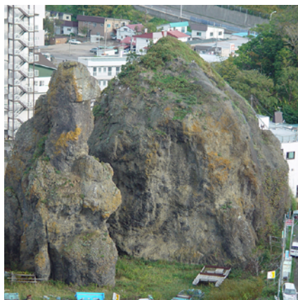
ウトロのゴジラ岩

合地学芸員の地質観察会を、配信によりおうちでお楽しみいただけます!知床半島は、峰浜付近の半島基部の海岸線に堆積岩、それから先端部にかけての海岸線に海底火山活動の地層、そして半島の中軸部には陸上火山活動の岩石があります。第一弾として、1. 野外での露頭観察、2. 手にとつての観察、3. 顕微鏡での観察、4. そのでき方について、写真や図を用いて解説します。▶配信日：3月25日(金)~5月末 ▶配信方法：視聴希望者にYoutubeの期間限定URLをメールでお送りします。▶申込方法：件名を「配信希望」とし、お名前、電話番号を明記の上、博物館にメール(shiretoko-m@sea.plala.or.jp)してください。難しい場合は博物館へ電話にてお申し込みください。