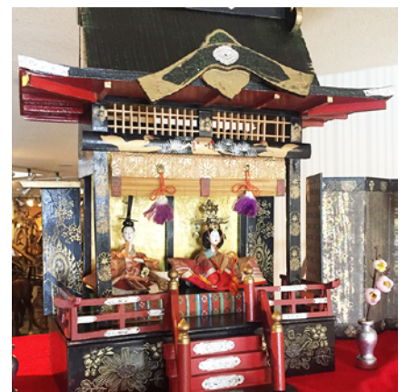
展示中の雛人形の最上段の様子

約90年前の1933(昭和8)年に購入されたひな人形を展示します。▶期間：~3月15日(火) ▶場所：本館受付前※この展示の観覧は無料。